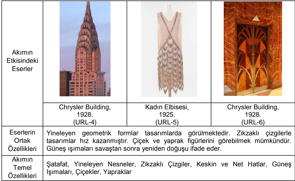
Şekil 4. Art Deco Akımı Etkisindeki Eserler