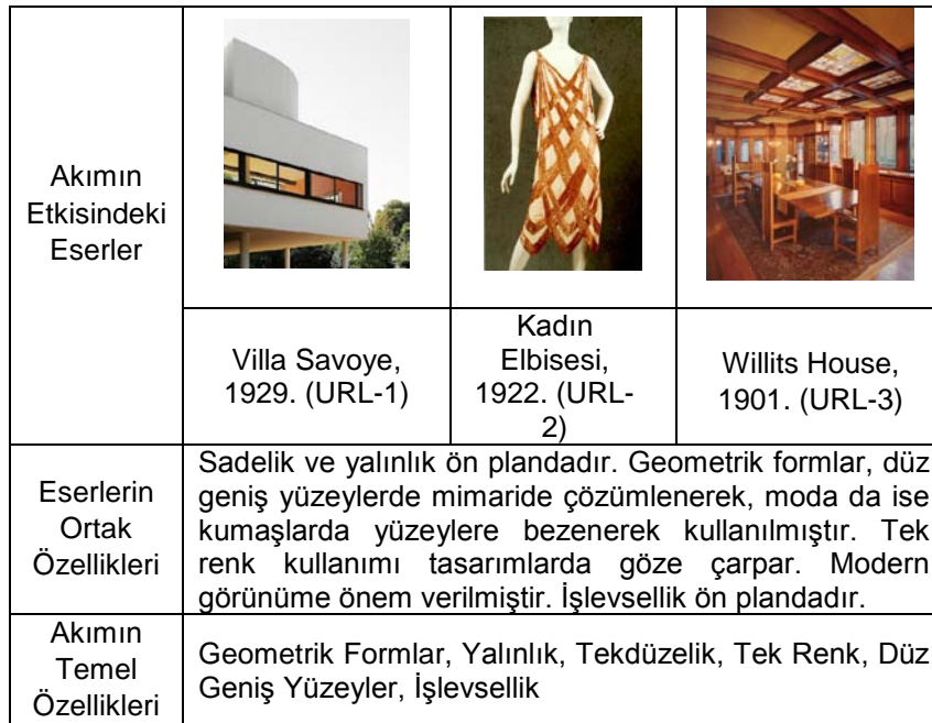
Şekil 3. Kübizm Akımı Etkisindeki Eserler

Kübizm’de her üç disiplinde de geometrik biçim kullanımı ile biçim çokluğundan biçim bütünlüğüne gidiş anlayışında; yalınlıktan da taviz verilmeden yatay ve düşey hatların vurgulandığı tasarımlar görülür. Sade düz geniş yüzeyler her üç disiplinde de göze çarpar. Döneminde ki sosyal olayların etkisi altında özgün biçimlendirme ile işleve uygun kıyafetler ve mekanlar tasarlanmıştır.