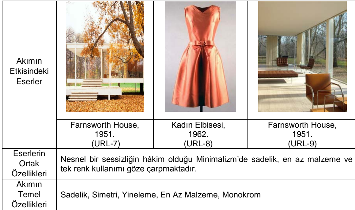
Şekil 5. Minimalizm Akımı Etkisindeki Eserler